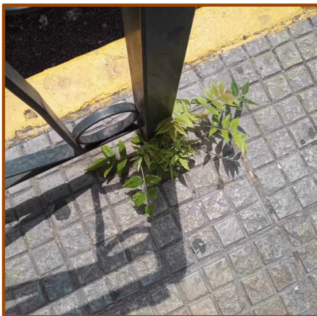
Εικ. 1: Ailanthus altissima ως αγριόχορτο, Δήμος Περιστερίου.

Αντίστοιχα, στο ίδιο παρτέρι ο INF-2 ο οποίος είναι και ο ίδιος κάτοικος της ίδιας πολυκατοικίας, έχει φυτέψει το ανθοφόρο φυτό Brugmansia arborea . Ο ίδιος οδηγήθηκε στην απόφαση αυτή πριν από χρόνια λόγω των ιδιαίτερων κίτρινων λουλουδιών του, καθώς και της ευχάριστης μυρωδιάς τους κατά τις νυχτερινές ώρες. Μια διέγερση των αισθήσεων της όρασης και της όσφρησης που παραπέμπει σε μια διευρυμένη αντίληψη της αισθητικής ως έννοιας, πέραν του οπτικού στοιχείου. Τα δυο φυτά που αναφέρθηκαν, κλαδεύονται, ποτίζονται και επιβλέπονται σε καθημερινή βάση από τους «ιδιοκτήτες» τους.