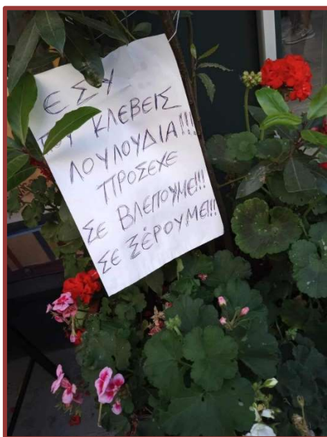
Εικ. 4: Η γλωρίδα ως διακόσμηση και ιδιοκτησία, Δήμος Καλλιθέας.

Με βάση τη σύντομη αυτή αναφορά σε διαφορετικά είδη φυτών και τη σχέση τους με τον άνθρωπο αλλά και το ανθρωπογενές περιβάλλον, μπορούν να διατυπωθούν ορισμένα συμπεράσματα. Οι μεταβλητές που ρυθμίζουν την αλληλεπίδραση των ανθρώπων με τα φυτά είναι τέσσερις: η χρηστικότητα, η παρεμβατικότητα, η αισθητική και η ιδιοκτησία. Κάθε αλληλεπίδραση εμπίπτει σε τουλάχιστον δύο από τις παραπάνω κατηγορίες (για παράδειγμα βλ. εικόνα 4). Οι τελευταίες αποτελούν συμβολικές νοηματοδοτήσεις των ειδών των φυτών από τον άνθρωπο με βάση τις πρωτογενείς (π.χ. τροφή) ανάγκες του αλλά και άλλες που αφορούν τις παραμέτρους της ιδιοκτησίας και της αισθητικής.