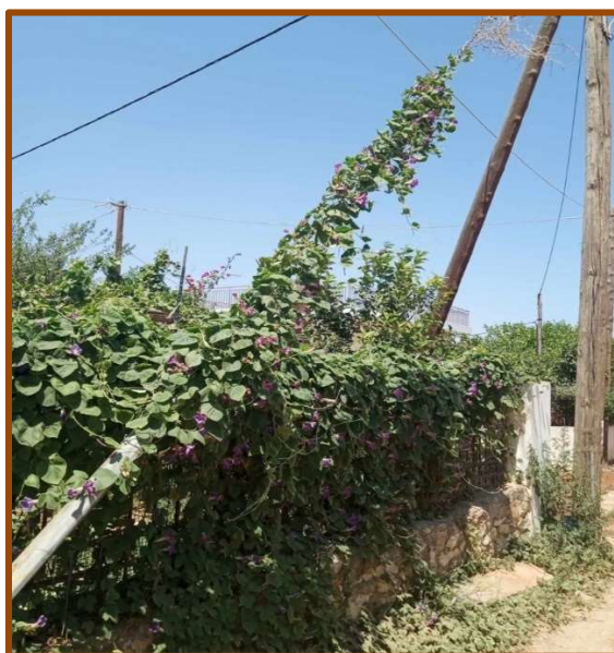
Εικ. 3: Catharanthus roseus , Δήμος Μαραθώνα.

Έξω από το αστικό περιβάλλον, στην περιφέρεια, παρατηρούνται και εκεί παρόμοιες καταστάσεις. Σημαντική διαφορά, ωστόσο, αποτελεί η μεγαλύτερη ποικιλία ειδών που κάποιος μπορεί να συναντήσει. Ένα αναρριχητικό φυτό που σε γενικές γραμμές χρησιμοποιείται και αυτό για την οριοθέτηση του χώρου από τους ιδιοκτήτες είναι το αιθαλές και πολυετές Ipomoea indica . Όπως όμως φαίνεται στην εικόνα 2, το φυτό αυτό σε μια περίπτωση έχει καταφέρει να ανέβει προς την κατεύθυνση της κολώνας ηλεκτροδότησης. Επιπλέον έχει εξαπλωθεί και στο πεζοδρόμιο. Πιθανό είναι το ενδεχόμενο η εξάπλωση του να γίνεται ανεκτή από τους κατοίκους, λόγω της μεγάλης διάρκειας της ανθοφορίας του, για αισθητικούς φυσικά λόγους. Το ίδιο μπορεί να ειπωθεί και για φυτά όπως το Catharanthus roseus , το οποίο, παρά το γεγονός πως δεν είναι αναρριχητικό, διατηρεί τον αισθητικό παράγοντα και ως εκ τούτου αναπτύσσεται ανενόχλητο και εκτός του χώρου ενός κήπου.