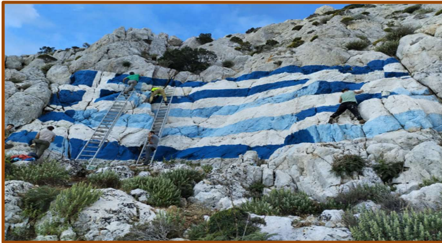
Εικ. 10: Η δημιουργία της ελληνικής σημαίας πάνω στα απόκρημνα βράχια του λόφου του Αγίου Σάββα από ομάδα δυναμιτιστών το 2021.

στην ιταλική προσπάθεια για το αυτοκέφαλο της Εκκλησίας της Δωδεκανήσου 10 και τον πετροπόλεμο των γυναικών του 1935 11 . Επιθυμούν να επιδείξουν την ψυχική και σωματική δύναμή τους και προκαλέσουν φόβο στον κάθε «εχθρό», στους Τούρκους, «στους Μεμέτηδες». Συγχρόνως αποτίουν φόρο τιμής σε γενναίους συμπατριώτες τους, που «έφυγαν» ή που «μάχονται στη θάλασσα, που έχουν μαρκάρει» 12 . Αποτελεί ιδανική έμφυλη, ανδρική αναπαράσταση αντίστασης 13 . Άλλωστε στα σημεία που γίνονται οι ρίψεις των δυναμιτών, πάνω στα απόκρημνα βράχια υπάρχουν ελληνικές σημαίες. Στο ύψωμα του Αγίου Σάββα έβαψαν ελληνική σημαία 30 μέτρων 14 (Εικ. 10) το 2019 και στο Μαυροβούνι, ακριβώς κάτω από το Εκκλησιάκι της Ανάστασης και του Σταυρού έβαψαν ελληνική σημαία 375 τμ τη Μεγάλη Δευτέρα, στις 2 Απριλίου 2018. Στο κάστρο του χωριού, κατεξοχήν οικιστικό κέντρο του νησιού κατά την περίοδο του Μεσαίωνα και κατά την εποχή της Ιπποτοκρατίας, κρεμούν μεγάλες, υφασμάτινες σημαίες με την έναρξη των ρίψεων (Εικ. 11).