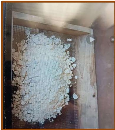
Εικ. 4: Κοσκίνισμα υλικών με κόσκινο

Πιστεύουν ότι όσο περισσότερο διαρκεί αυτό το στάδιο της προετοιμασίας, δηλαδή, η μετατροπή της πυρίτιδας με την τριβή σε πολύ μικρούς, σχεδόν αόρατους, κόκκους, τόσο εντυπωσιακότερη καθίσταται η έκρηξη. Ο ικανός δυναμιτιστής διακρίνεται από τα ανεξίτηλα, κίτρινα ίχνη στα δάχτυλα του. «Δεν καθαρίζουν εύκολα». Όλα τα υλικά που χρησιμοποιούνται, ζυγίζονται με ακρίβεια (Εικ. 5). Οι ποσότητες πρέπει να είναι συγκεκριμένες, γιατί διαφορετικά οι κίνδυνοι πολλαπλασιάζονται.