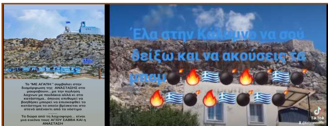
Εικ. 17: Δημιουργήματα υβριδισμού στο διαδίκτυο, το Πάσχα 2024.

Άλλοτε, δέχονται δωρεές από πλούσιους Καλύμνιους ομογενείς ή ακόμα και από επιχειρηματίες του νησιού, αφού πιστεύουν ότι αυξάνεται η επισκεψιμότητα του νησιού (Ηγουμενάκης, 1997). Συχνά συγκεντρώνεται το απαιτούμενο ποσό με λαχειοφόρο αγορά. Συστηματικά και σκόπιμα διαφημίζουν τη ρίψη των δυναμιτών στο διαδίκτυο, που δρα ως ένας λαογραφικός αγωγός (Γκασούκα & Φουλίδη, 2012· Κατσαδώρος, 2013 και στο οποίο προκύπτουν «δημιουργήματα υβριδισμού» (Blank, 2012, 2013· Howard, 2008a, 2008b). Στόχος είναι συγκεντρωθεί μεγαλύτερο ποσό, που θα διατεθεί για την αγορά περισσότερων υλικών (Εικ. 17).