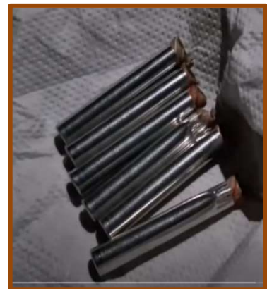
Εικ.7: Το καπούλι

Στο δεύτερο στάδιο της δημιουργίας του δυναμίτη, το στάδιο της ανάμειξης τοποθετούνται σε τεμαχισμένη εφημερίδα ή σε χαρτί ή σε πλαστική σακούλα συγκεκριμένη ποσότητα αμμωνίας, που ζυγίζεται με ακρίβεια, το «γερμανικό» (Εικ. 5) και ένα μικρό κομμάτι πρωτογενούς εκρηκτικής