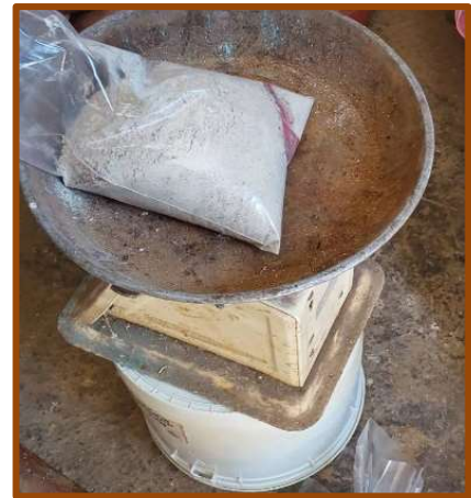
Εικ. 5: Το ζύγισμα των υλικών