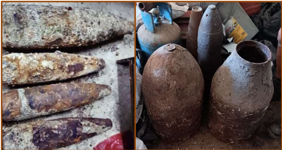
Εικ. 1 (α - β): Βόμβες που χρησιμοποιήθηκαν κατά τον Β' Παγκόσμιο Πόλεμο και βρέθηκαν στην Κάλυμνο.

Οι συγκεκριμένοι δυναμίτες είναι αυτοσχέδιες κατασκευές βάρους ενός έως τριών κιλών, που κατασκευάζονται στην Κάλυμνο. Τα υλικά μεταφέρονται στο νησί σε συνθήκες άκρας μυστικότητας, γιατί η εμπορία και η κατοχή τους σύμφωνα με την ισχύουσα νομοθεσία είναι παράνομη. Αρχικά, χρειάζεται να δημιουργηθεί η σκόνη, οι λεπτοί κόκκοι από πυρίτιδα, δηλαδή, από μπαρούτι που κοπανιέται καλά μέσα σε μεγάλο γουδί με ξύλινο κόπανο.