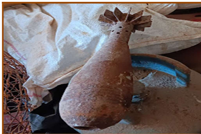
Εικ. 2: Βόμβα του Β΄ Παγκοσμίου Πολέμου που συνέλλεξαν αλιείς από το βυθό σε θαλάσσια περιοχή κοντά στην Κάλυμνο.

Τις περισσότερες φορές χρησιμοποιούν πυρίτιδα 4 , που υπάρχει στις βόμβες του β΄ παγκοσμίου πολέμου που έχουν βρεθεί σε ορεινές και σε θαλάσσιες περιοχές του νησιού, αφού είναι σχετικά ομοιόμορφη και δεν αλλοιώνεται με τον καιρό (Εικ. 1 α-β & Εικ. 2). Το κοπάνισμα, η άλεση, αν και δημιουργεί εντονότατη πίκρα στο στόμα όσων βρίσκονται σε κοντινή απόσταση, εξασφαλίζει τη λάμψη στην έκρηξη (Εικ. 3). Στη συνέχεια κοσκινίζεται σε μεγάλο κόσκινο (Εικ. 4) ή σε ειδική μηχανή. Τα μεγάλα κομμάτια ρίχνονται πάλι στο κοπανιστήρι μέχρι να γίνουν σκόνη (Εικ. 3). Στο τέλος αυτής της διαδικασίας οι λεπτοί κόκκοι τοποθετούνται σε πλαστικό μπουκάλι.