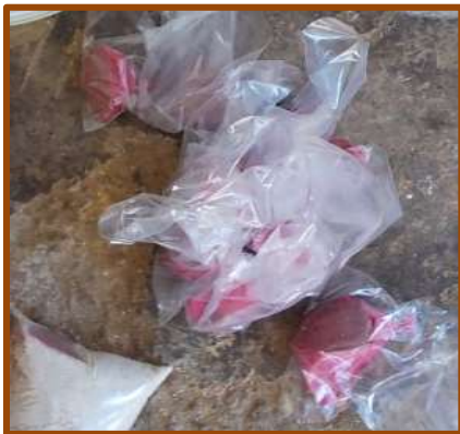
Εικ. 6: Το σαλάμι