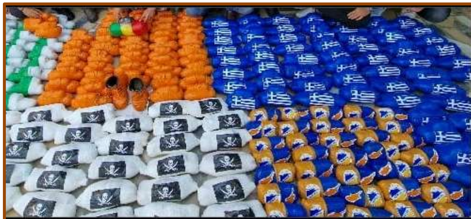
Εικ. 9: Οι δυναμίες του Πάσχα 2024.