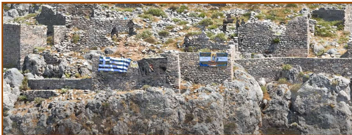
Εικόνα 11: Ρίψεις δυναμιτών από το κάστρο του Χωριού με αναρτημένες ελληνικές σημαίες, το Πάσχα του 2023.

Οι δυναμιτιστές σε κατάσταση εκστασιασμού 15 συμμετέχουν στις εορταστικές εκδηλώσεις του ορθόδοξου Πάσχα, που σημαίνει στα εβραϊκά «διάβαση» 16 . Χαρακτηριστικά επισημαίνουν τον Ιούλιο 2024: «Αλλιώς δεν καταλαβαίνουμε Πάσχα. Εάν κάμουμε λάθος, φεύγει χέρι, εάν κάμουμε μεγάλο λάθος, φεύγει η ζωή».