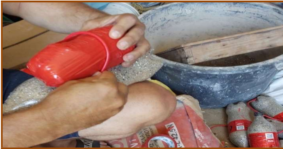
Εικ. 8: Το δέσιμο των υλικών.

ουσίας νέας γενιάς, το γαλάκτωμα που παρασκευάζεται από διάλυμα νιτρικού αμμωνίου 5 , ελαιώδη συστατικά, γαλακτωματοποιητή κ.λ.π. περίπου 5 εκατοστών, το «σαλάμι» (Εικ. 6).