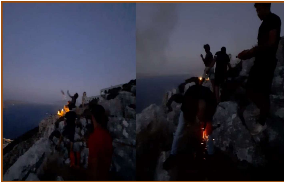
Εικ. 13: Η ρίψη δυναμιτών από τον Άγιο Σάββα, βραδινές ώρες.

Μαυροβούνι και από τον Άγιο Στέφανο, περιοχές ακραία δυσπρόσιτες, δύσβατες πάνω σε απόκρημνα, «άγρια» βράχια και σε απότομους γκρεμούς. Στις συγκεκριμένες τοποθεσίες τα πετρώματα συχνά αποκολλιούνται από τις ισχυρές δονήσεις, ώστε να υπάρχει ο μόνιμος κίνδυνος να κατακυλήσουν μέχρι τον οικισμό ή και να παρασύρουν ανθρώπους στο γκρεμό. Η επιτέλεση 23 αποτελεί δημόσιο γεγονός (Handelmal, 1997). Πλέον το περιβάλλον, τα απόκρημνα βράχια στα υψώματα της Πόθιας και του Χωριού δεν μετατρέπονται σε ένα άβατον προορισμένο αποκλειστικά για τους επιτελεστές, αφού, όλοι/ες αντικρίζουν τις γνώστες φιγούρες τους από απόσταση. Συγχρόνως το κοινό, το ακροατήριο βρίσκεται σε κοντινή απόσταση, εξοικειωμένο προς την επιτέλεση ακόμα και το «ξένο», που είναι φιλικά προσκείμενο (Schechner, 2002). Προσκαλείται να συμμετέχει, αφού όλες οι απαραίτητες προφυλάξεις τηρούνται και υπάρχει απόλυτη ασφάλεια (Τυρίκος-Εργάς, 2016).