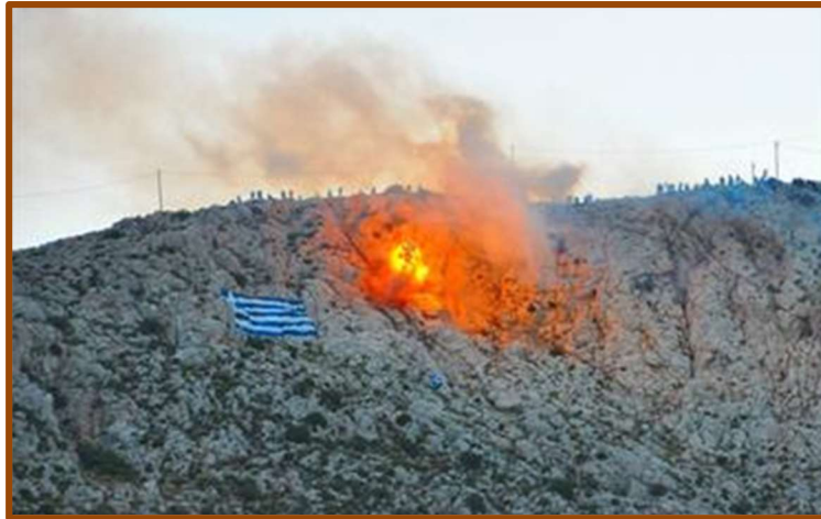
Εικ. 14: Η ρίψη δυναμιτών από τον Άγιο Σάββα, πρωινές ώρες.