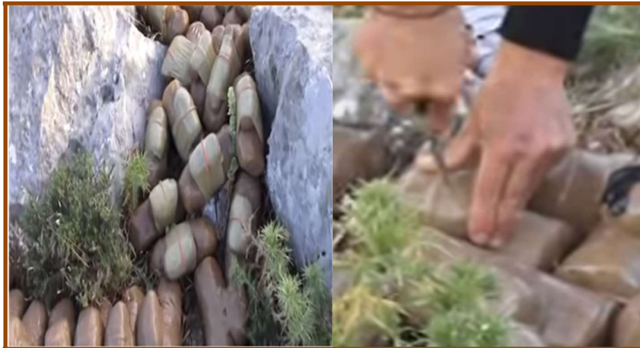
Εικ. 13 (α-β): Η τοποθέτηση των δυναμιτών ανάμεσα στους βράχους και το φυτίλωμα.

Τα τελευταία χρόνια στο βουνό βρίσκονται και γυναίκες. Παλιότερα κάλυπταν επιμελώς, τις περισσότερες φορές, το κεφάλι τους με μαντήλια, καπέλα, κουκούλες, γυαλιά ηλίου, ώστε να μην είναι δυνατόν να αναγνωριστεί εύκολα η ταυτότητά τους. Πλέον, δεν ενδιαφέρονται να αποκρύψουν τα χαρακτηριστικά τους, αλλά μόνο να προστατευτούν από τον έντονο ήλιο ή από τον δυνατό αέρα. Το πρωί του Μ. Σαββάτου 21 τοποθετούν τους μεγάλους, βαριούς σάκους και τα γεμισμένα τσουβάλια σε αγροτικά αυτοκίνητα. Γνωρίζουν καλά το πεδίο, έχουν επιλέξει προσεκτικά τα «πατήματά τους». Ξεφορτώνουν το φορτίο, το κουβαλούν στους ώμους προς τα κατάλληλα σημεία μέσα από τα κακοτράχαλα μονοπάτια. Στη συνέχεια βγάζουν από τα τσουβάλια τους δυναμίτες και τους τοποθετούν πάνω στα απόκρημνα βράχια (Εικ. 12α) με προσοχή, για να εκμηδενίσουν την πιθανότητα ατυχήματος κατά την φορτοεκφόρτωση των εκρηκτικών. Λίγο πριν τη ρίψη γίνεται το «φυτίλωμα», δηλαδή ανοίγουν με μικρό μαχαίρι ή με σουγιά ή με σουβλί μια οπή και εκεί τοποθετούν το καπούλι και μετά το βραδύκαυστο φυτίλι, κατάλληλο για χρονοκαθυστέρηση καύσης, πάχους περίπου 5-6 χιλιοστών (Εικ. 12β).