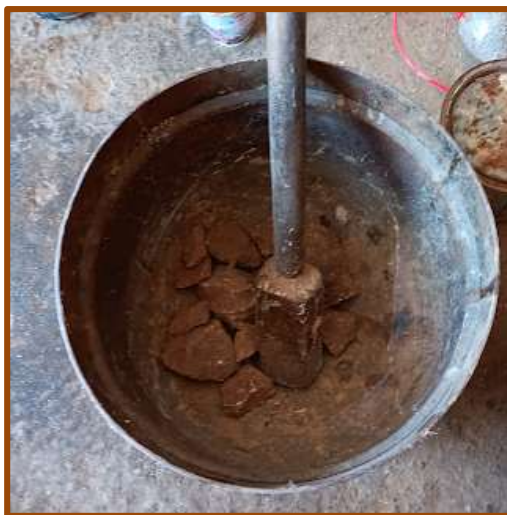
Εικ. 3: Ξύλινος κόπανος, μεταλλικό, μεγάλο γουδί, με μεταλλική απόληξη για θλίψη υλικών.

Τις περισσότερες φορές χρησιμοποιούν πυρίτιδα 4 , που υπάρχει στις βόμβες του β΄ παγκοσμίου πολέμου που έχουν βρεθεί σε ορεινές και σε θαλάσσιες περιοχές του νησιού, αφού είναι σχετικά ομοιόμορφη και δεν αλλοιώνεται με τον καιρό (Εικ. 1 α-β & Εικ. 2). Το κοπάνισμα, η άλεση, αν και δημιουργεί εντονότατη πίκρα στο στόμα όσων βρίσκονται σε κοντινή απόσταση, εξασφαλίζει τη λάμψη στην έκρηξη (Εικ. 3). Στη συνέχεια κοσκινίζεται σε μεγάλο κόσκινο (Εικ. 4) ή σε ειδική μηχανή. Τα μεγάλα κομμάτια ρίχνονται πάλι στο κοπανιστήρι μέχρι να γίνουν σκόνη (Εικ. 3). Στο τέλος αυτής της διαδικασίας οι λεπτοί κόκκοι τοποθετούνται σε πλαστικό μπουκάλι.