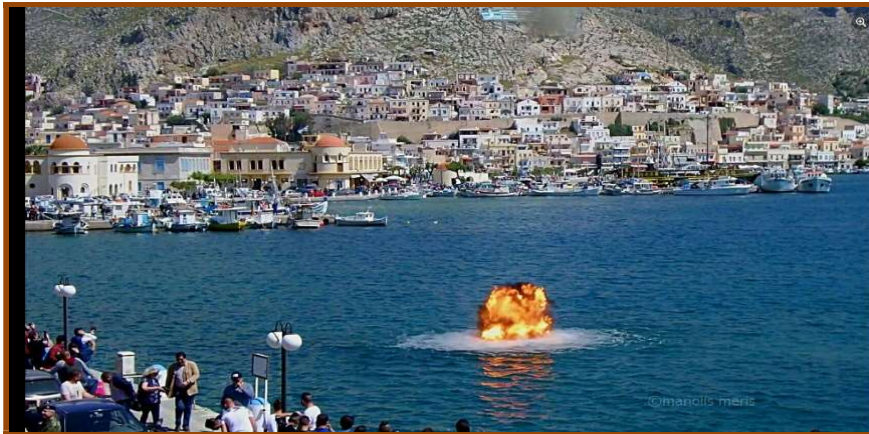
Εικ. 15: Ρίψη δυναμιτών από την προβλήτα του λιμανιού της Πόθιας.

Η ρίψη των δυναμιτών συνεχίζεται εκτεταμένα το βράδυ της Ανάστασης 25 . Αμέσως μετά το «Χριστός Ανέστη» δίνεται το πρόσταγμα μ' ένα καπνογόνο και τα τσιγάρα ανάβουν. Μικρές, μαύρες κουκίδες εκσφενδονίζονται, φαίνονται στον ουρανό, ίπτανται για λίγο στον αέρα και συνέχεια πέφτουν. Οι εκκωφαντικοί ήχοι, είναι τόσο δυνατοί που υπερβαίνουν τις δυνατότητες του ανθρώπινου αυτιού. Ακολουθούν τα έντονα ωστικά κύματα που σείουν την πρωτεύουσα του νησιού. Οι εκτυφλωτικές λάμψεις φωτίζουν τον ουρανό. Οι εκρήξεις γίνονται εμφανείς στη γειτονική Κω, ενώ ανάλογα με τη φορά του αέρα, ο ήχος της έκρηξης ενδέχεται να φτάσει και στα Τουρκικά παράλια. Αναμφισβήτητα λόγω του σκοταδιού το θέαμα καθίσταται εντυπωσιακότερο (Εικ. 13).